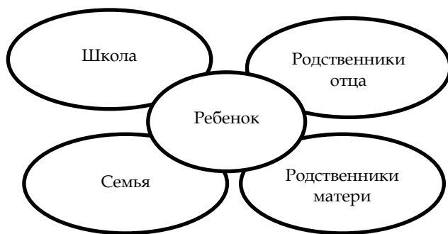
Рис. 1. Система первого уровня социальной сети подростка

Системы первого уровня У. Бронфенбреннер называет микросистемами. В микросистеме внимание специалистов должно сосредотачиваться на отношениях, существующих внутри определяемой системы. Например, рисунок 1 показывает особенности системы первого уровня, куда может входить подросток.